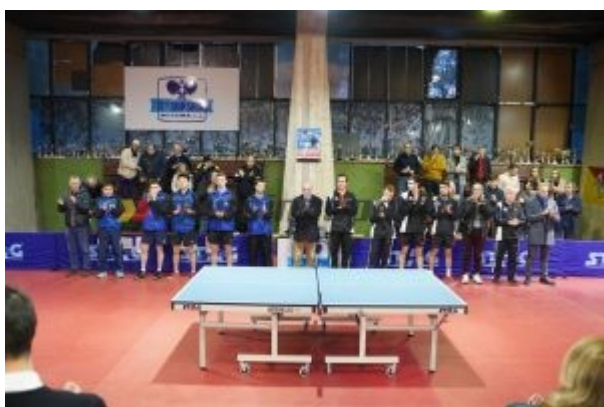
AON Milano Sport e Top Spin Messina