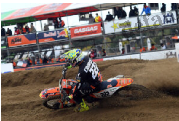
Tony Cairoli in azione durante il GP in Belgio

Prosegue il tritico di gare in Belgio del campionato mondiale di motocross . Si Ã il corso mercoled il secondo dei tre Gran Premi consecutivi in programma sulla pista di Lommel , con il pattese Tony Cairoli che compie un balzo in avanti in termini di competitivit rispetto alla gara di domenica, salendo sul gradino pi 1 basso del podio.