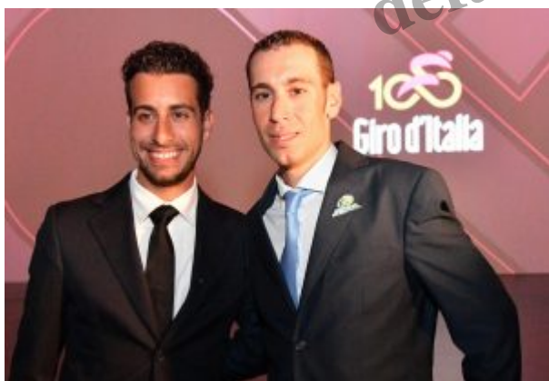
Fabio Aru e Vincenzo Nibali

Nessuna sorpresa per l' edizione numero 100 del Giro d'Italia : partenza da Alghero il 5 maggio e arrivo a Milano il 28 maggio per complessivi 3.572 chilometri. Il tracciato sar  interamente in territorio italiano e i ciclisti si confronteranno lungo tutto lo stivale. Ci saranno opportunit  per i velocisti e per gli scalatori. I coraggiosi uomini jet si sfideranno gi  nella prima frazione, giocandosi col coltello tra i denti la maglia rosa.