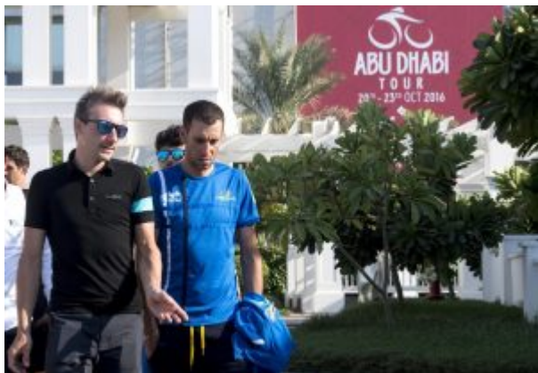
Vincenzo Nibali e il campione olimpico Elia