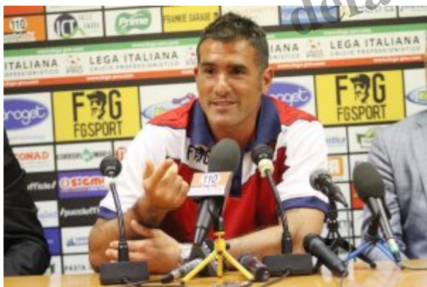
Lucarelli in conferenza stampa da allenatore

Seguiranno un titolo di capocannoniere nel 2004-05, con tanto di doppietta all'esordio contro il Milan (davanti a 10.000 livornesi in bandana a San Siro), e tante altre prodezze, per un totale di 101 reti tra A, B, Coppa Italia e Coppa Uefa, con la storica partecipazione dei labronici alla manifestazione continentale. Gli ucraini dello Shakhtar Donetsk lo ricoprono d'oro nel 2007 e l'anno seguente ottiene anche la ribalta della Champions League. Quindi il trasferimento al Parma , prima del nuovo ritorno a Livorno nel 2009-10, condito da altre 10 marcature all'attivo. Chiude la carriera nel 2012 nel Napoli di Mazzarri , suo grande estimatore. Con l'Italia conta 6 presenze e 3 reti, la prima delle quali nell'amichevole giocata nell'era Lippi a Toronto contro la Serbia (in campo anche allora messinese Carmine Coppola ). Ha fatto inoltre parte dell'Under 21 e disputato le Olimpiadi di Atlanta '96.