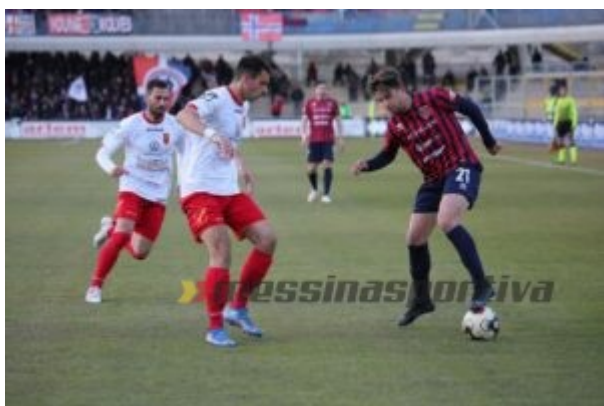
Statella e Trasciani in fase di copertura

Messina il calciatore calabrese sta coprendo diverse zone del campo senza risentire di essere da una fascia all'altra. Il ritorno in Lega Pro ha rappresentato una motivazione importante nel ruolo di esterno, abituato da tanto tempo in carriera ad agire sulle due fasce. Poi conta anche l'avversario che trovi di fronte. La squadra vanta la necessaria esperienza perché ci sono momenti delle gare nei quali devi avere la qualità per gestire il risultato. Personalmente non ero mai sceso in serie D in carriera, una categoria che ho conosciuto ad inizio anno a Lavello. Non nascondo di non essermi trovato a mio agio anche per aver avuto delle difficoltà extra campo. Sono ritornato a Messina in Lega Pro, campionato che prediligo, e ho subito capito che la situazione è molto differente. Questa piazza non ha nulla a che vedere con la categoria”.