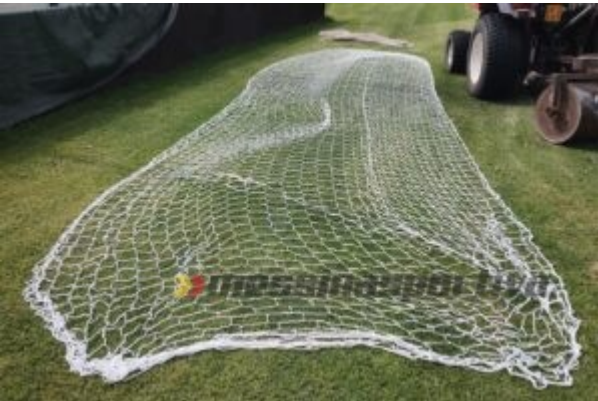
Le nuove reti delle porte