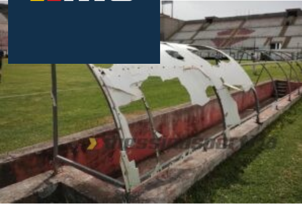
Le vecchie panchine erano ormai inservibili