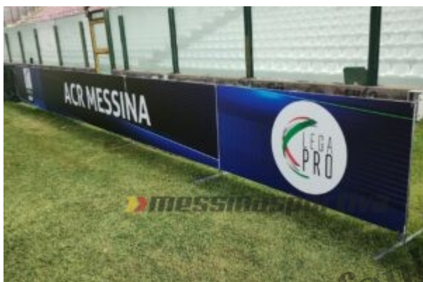
Il cartellone collocato a bordo campo