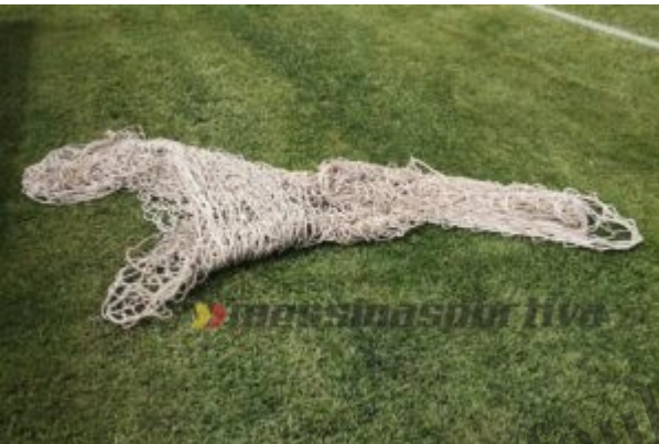
Rimosse le vecchie reti malandate