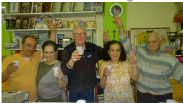
La famiglia Nibali celebra un successo di Vincenzo