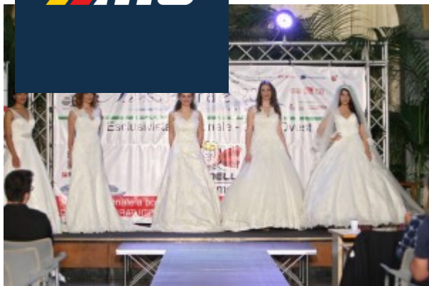
La sfilata di Bertia Mode