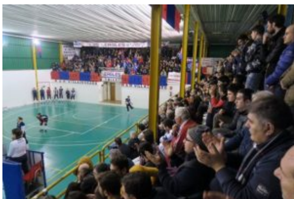
Il colpo d'occhio del PalaBucalo