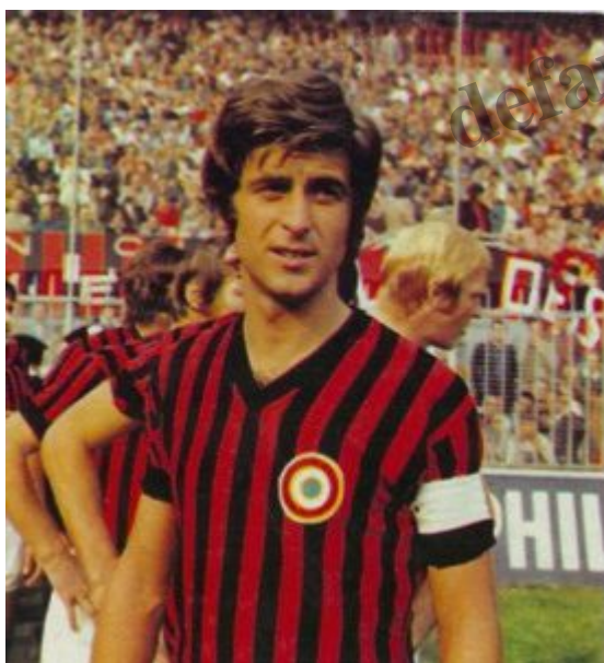
Rivera con la maglia del Milan