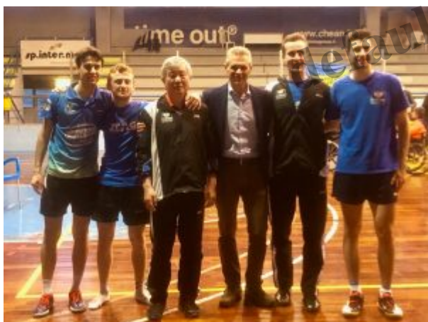
Top Spin Messina al completo

Cresce l'attesa per la gara d'andata della finale scudetto di serie A1 maschile di tennistavolo. E' un momento storico per la Top Spin Messina , giunta all'ultimo atto che assegnerà il tricolore, dopo aver chiuso al terzo posto il campionato e superato poi in semifinale playoff l'Apuania Carrara, con due successi da urlo.