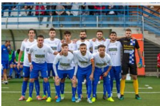
Una formazione del Rocca di Caprileone

Cosa ha colpita di più di questo gruppo? E quali sono i margini di miglioramento? «Se devo dire una cosa che mi ha colpito di questo gruppo è la condivisione che si vedeva dentro e fuori dal campo, negli allenamenti, durante le cene che si organizzavamo e durante le gare. Anche nei momenti più difficili, quando sembrava che il banco potesse saltare questi ragazzi non hanno mai mollato, dimostrando di essere una famiglia. Di questo ne sono estremamente orgoglioso e li ringrazio per sempre. I margini di miglioramento sono sempre tanti, basta credere nel lavoro, essere concentrati ed avere la mentalità giusta per affrontare questo sport nel modo migliore per la crescita personale in primis come uomo e poi come calciatore. I ragazzi che ho allenato queste regole le hanno seguite a pieno ed hanno ancora ampissimi margini di miglioramento e spero che da domani potremmo rimetterli già in pratica».