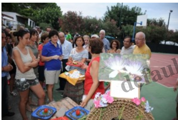
Degustazione prodotti locali a Vulcano

Il “15° Giro Podistico a Tappe delle Isole Eolie” non è solo corsa. La manifestazione nazionale FIDAL, organizzata dalla Polisportiva Europa Messina con la collaborazione della Mediterranea Trekking ed il patrocinio dei comuni di Lipari, Leni, Malfa e Santa Marina Salina , proporrà, infatti, ai partecipanti, provenienti da tutta Italia, una settimana (dal 6 al 12 settembre) di sport e turismo.