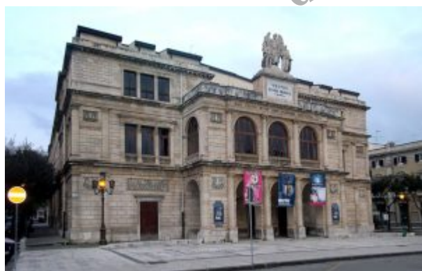
Il Teatro Vittorio Emanuele di Messina

Lo scorso 24 ottobre si Ã¨ aperta la nuova campagna abbonamenti dedicata alle stagioni 2017-2018 del Teatro Vittorio Emanuele . Come da prassi la partenza Ã¨ stata dedicata all'esercizio del diritto di prelazione che tutti i vecchi abbonati possono esercitare sulla poltroncina occupata la stagione precedente. Reazioni positive del pubblico messinese hanno da subito fatto registrare numeri da record: in soli 6 giorni 500 abbonati alla stagione scorsa hanno scelto di confermare la propria scelta. Tutti i giÃ tesserati, mini e full, per le sezioni Musica e Prosa avranno ancora tempo per assicurarsi la propria poltroncina a condizioni vantaggiose sino a domenica 5 novembre.