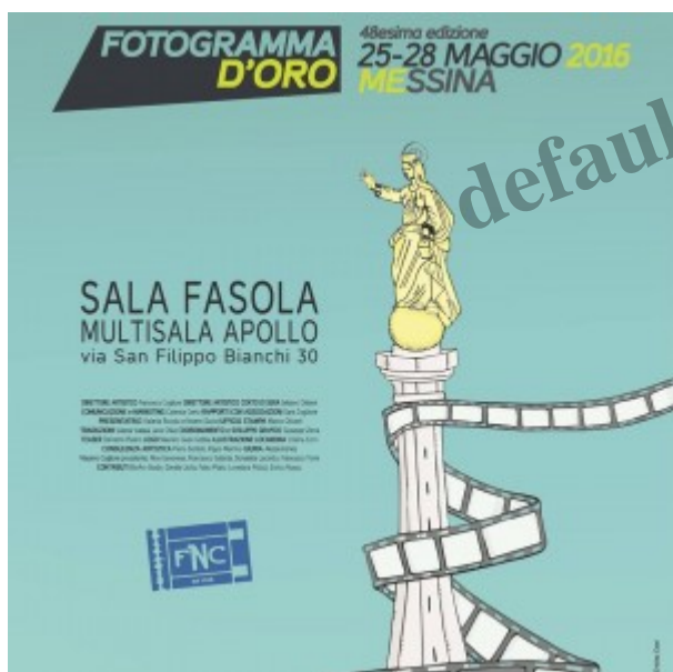
La locandina dell'evento

E’ tutto pronto per la rassegna del cinema indipendente “ Fotogramma d’Oro Film Fest ”, giunta alla 48 ª edizione e che per la prima volta si svolgerà nella città in riva allo stretto.