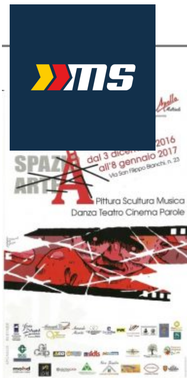
La locandina dell'evento