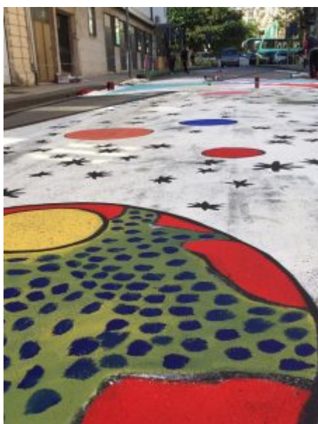
La strada che diventa opera