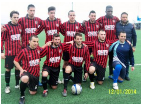
I "leoni" del Pistunina

Al 45' tanto per cambiare, Ingemi (eccellente la sua prestazione specie nel primo tempo) a rubare palla sulla tre quarti innescando La Speme la cui pronta girata viene parata a terra da Lamonica.