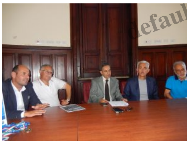
Un momento della conferenza stampa

Annunciata un'edizione scoppiettante dei Campionati Regionali Individuali Assoluti di atletica leggera, validi pure come terza fase dei CdS su pista. L'importante manifestazione FIDAL, che si svolgerà sabato e domenica al campo scuola "Cappuccini", è stata presentata nella Sala Ovale di Palazzo Zanca .