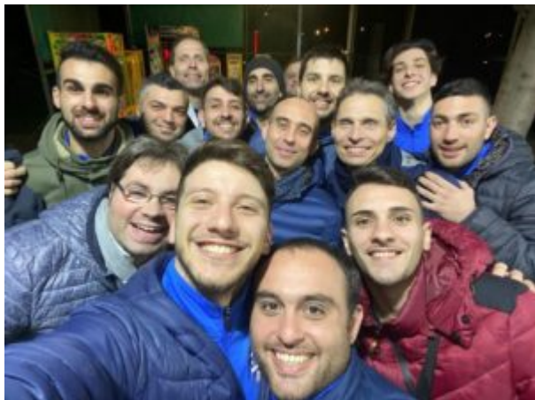
La Pgs Luce al gran completo, formato selfie

La possibilità di giocare sul campo un posto al sole: “Con la sospensione delle attività non probabilmente delle promozioni d’ufficio . Abbiamo un’ottima posizione in campionato con il Quotidiano Martelli – ma questa potrebbe non bastare per farci compiere il salto di categoria. Un peccato non giocare una simile opportunità dopo tanti sacrifici, quindi speravo che presto ci fossero le condizioni per tornare in campo”.