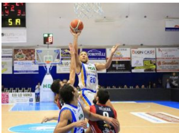
Triche con la mancina (Orlandina-Biella)