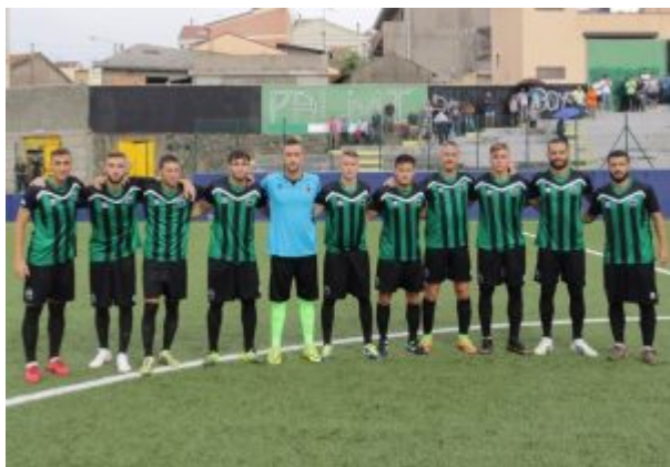
Seconda vittoria della Palmese, che piomba in zona play-off

Il balzo maggiore resta quello dell'imbattibile Palmese , che affonda e risorge nel raggio di una sola gara. Ancora imbattuto, l'undici di Franceschini torna alla vittoria contro un Troina pugnace, che passa in vantaggio ma si scontra col cuore dei calabresi. E' dunque un'illusione il lungo vantaggio dei rossoblù, aperto al 34' dalla rete di Didiba . La Palmese dimostra ancora di amare i bracci di ferro e cova, per tutto il secondo tempo, una rimonta che scoppia in appena quattro minuti.