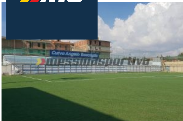
Prima vittoria del Gela in casa. Il "Vincenzo Presti" resta deserto

I nisseni, stavolta, si prendono il terzo posto e smorzano le fatiche dell'avvio, con la collaborazione del Roccella . Gli jonici, che crollano verticalmente sul 5-1, salvano la faccia con la rendita dei 9 punti in classifica, sufficienti ad evitare sorpassi. Ed in appena mezz'ora gli uomini di Giampà sono sotto di due gol, a firma di Alma e Polito . La ripresa inizia con più equilibrio, ma intorno alla metà Dieme , ancora Alma e La Vardera riprendono il tiro al bersaglio. Faella alleggerisce il passivo. Pur ancor a porte chiuse, il Presti non è più un tabù per il suo club, al primo successo interno.