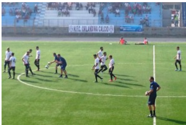
Il Messina a Capo d'Orlando nel corso del riscaldamento