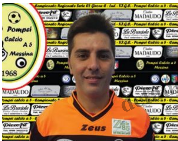
Gambino del Pompei

Risultati quarta giornata: Città di Barcellona-Sant'Antonino 6-5, Libertas Zaccagnini-Pompei 0-4, Meriense-Ludica Lipari 10-7, Or.Sa P.G.-Akron Savoca 6-3, Siac-Montalbano 10-4, Sporting Club Villafranca-Nike Club 4-2.