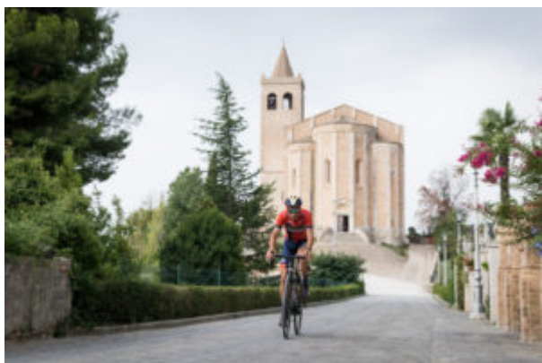
Vincenzo Nibali a Offida per promuovere la regione Marche

ante della Regione Marche Luca Ceriscioli "€. Gli spot realizzati lo scorso anno, in presenza di Covid, funzionano bene per questa nuova ripartenza. Risultano perfetti e calibrati per un territorio che riprende un percorso bruscamente interrotto. Oggi tante imprese si sono rese a fare comunicazione pubblicitaria, ma noi abbiamo il vantaggio di essere davanti, dietro la scia di Nibali che continua a spingere per le Marche. Stiamo mettendo in atto misure dirette per le imprese turistiche, che stanno dando un riscontro immediato, ma, in parallelo, investiamo su uno sviluppo strategico del settore, potendo contare sulla collaborazione di Nibali"•.