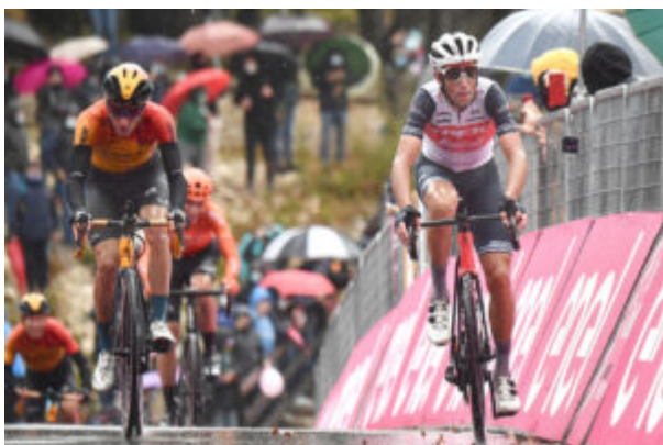
Nibali sul traguardo di Roccaraso

Intanto si va avanti e la maglia rosa Joao Almeida guadagna qualche secondo sui più diretti inseguitori, in quanto si piazza al secondo posto, dietro al solo Ulissi, nello sprint che assegnava la vittoria nella tappa che prevedeva tanta pianura ma con due Gpm come il Roccolo e il Calaone nel finale, autentici muri con pendenze che toccano il 17-18%. Proprio in quei frangenti, spinti dagli allunghi di Ulissi e del britannico Geoghegan, sono rimasti davanti in venti, fra i quali Almeida che già in precedenza aveva messo al lavoro i suoi per guadagnare terreno su Sagan , rimasto staccato.