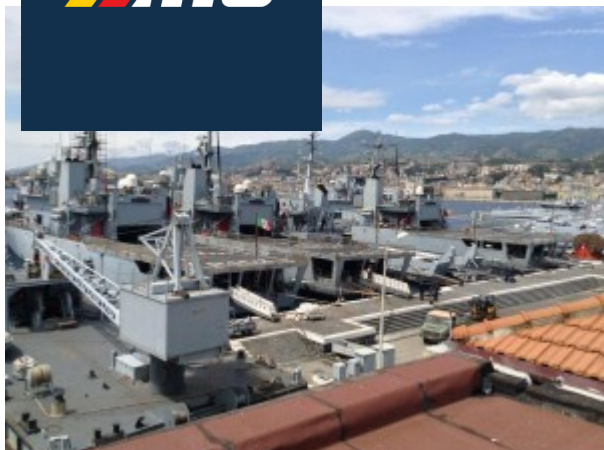
Il piazzale comando della base della Marina Militare nella zona falcata

Il programma prevede, durante le giornate espositive, a partire dalle ore 16, dimostrazioni in piscina di imbarcazioni radiocomandate mentre, venerdì 6 ottobre, alle 18 si terrà un incontro-conferenza sul tema «Il Modellismo quest'arte sconosciuta», con proiezioni di immagini; sabato e domenica dalle 16, esibizioni in mare di motoscafi radiocomandati, condimento permettendo. Oltre ai modelli e oggetti legati al mare, saranno esposti diversi pannelli fotografici con immagini sulla navigazione e sulla vita di bordo, di velieri, di personaggi illustri legati al mare, con alcune foto inedite. Durante l'apertura della mostra soci dell'Associazione Storico Modellisti Messinesi, guideranno il pubblico nella visita e daranno chiarimenti e notizie sui modelli esposti, sulle caratteristiche tecniche di quelli dinamici e facendo muovere i pezzi per farne apprezzare le capacità operative. Sarà l'occasione per conoscere l'arte di valenti artigiani del modellismo navale che hanno raccolto, molti esemplari particolari, esposti in un ambiente marino