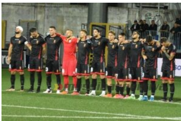
La formazione titolare del Messina

Il tecnico del Messina Giacomo Modica ha presentato la sfida con l’ Avellino : “Sono contento che stiamo creando empatia e simpatia tra la gente. I tifosi stanno apprezzando il grande impegno dei ragazzi, come stiamo in campo, cosa facciamo con coralità di gioco. Abbiamo raccolto poco rispetto a quanto profuso sul campo. Speriamo di continuare a proporre un gioco piacevole”.