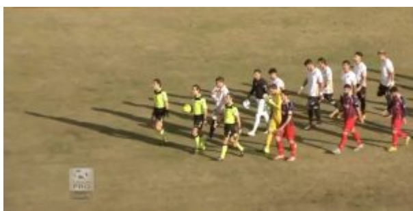
Ingresso in campo