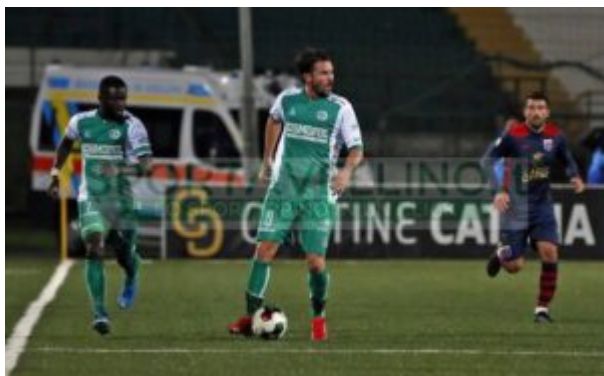
Maniero in azione

L'ultimo giorno della sessione estiva del calciomercato ha regalato tante altre ufficialità per quanto riguarda le squadre del girone C di Serie C rivali del Messina. Il Catanzaro , che si candida ad un ruolo da indiscussa protagonista, ha chiuso la campagna trasferimenti con un altro colpo, ingaggiando a titolo definitivo dalla Reggina l'esterno offensivo croato Mario Situm , ex anche del Cosenza. Ad aumentare il fascino del raggruppamento meridionale la presenza del Pescara che ha perfezionato un poker di acquisti di spessore: Jacopo Degosus in prestito dal Cagliari, a titolo definitivo il centrocampista Luca Palmiero dal Napoli e gli attaccanti Edoardo Vergani dalla Salernitana e Lubomir Tupta dal Verona.