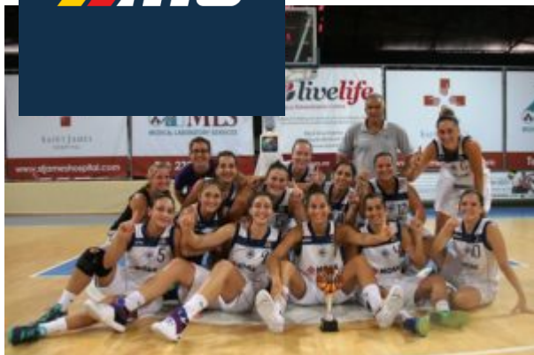
Mannella a Malta

Un aneddoto con un grande della pallacanestro messinese puÃ² aiutare a tratteggiare ancora meglio la figura dell'â€™ex trapanese: â€œI miei punti di forza riconosciuti erano la lettura del gioco, il palleggio, il passaggio e anche il tiro a canestro. Ricordo quando il grande Vittorio Tracuzzi disse di me che ero il ragazzo con la migliore velocitÃ di esecuzione mai vista in questi fondamentali. Quella considerazione detta da un grande allenatore rappresenta un onore per meâ€™.