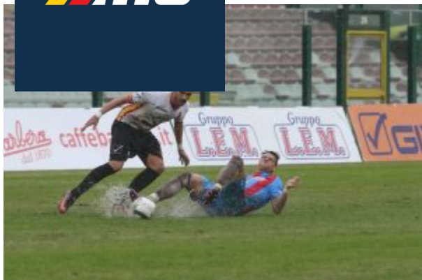
Una scivolata sul terreno inzuppato d'acqua

Il modulo migliore? Maccarrone non fa un discorso di numeri: “In campo non ci pensi. Sappiamo che vincendo sabato possiamo chiudere il discorso salvezza. Abbiamo già lavorato sugli schemi per affrontare il Melfi nel migliore dei modi ed in campo ci deve essere solo la voglia di batterli. Il futuro? Vorrei restare, a salvezza acquisita ne parleremo”.