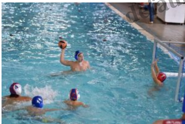
Un tiro dell'Ossidiana Marbi Messina

"Divertirsi giocando" sono le parole che hanno caratterizzato la partecipazione della squadra Under 11 dell' Ossidiana Marbi Messina alla prima tappa del torneo "Waterpolo Winter" S Challenge, organizzata dalla Nuoto Catania , che si è svolta alla piscina etnea "Francesco Scuderi".