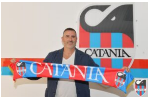
Cristiano Lucarelli posa con la sciarpa del Catania