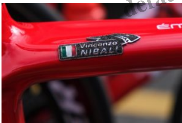
La bicicletta dello “squalo dello Stretto” Vincenzo Nibali

Un post sulla pagina ufficiale della Trek Segafredo (“ Lo squalo sta arrivando al Giro ”) ha ufficializzato la partecipazione di Vincenzo Nibali alla 104esima edizione del Giro d’Italia , in programma dall’8 (partenza da Torino) al 30 maggio (arrivo a Milano). Una caduta in allenamento e la conseguente frattura del polso destro avevano messo a rischio la partecipazione del ciclista messinese. SarÃ la decima partecipazione per lui: sei i podi finali con le vittorie del 2013 e 2016.