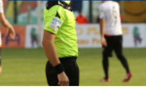
Il direttore di gara ha adottato un metro poco fiscale