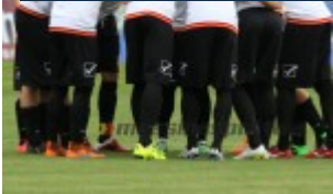
Il Messina si carica prima del via