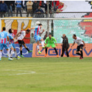
Un'offensiva degli etnei nel match del San Filippo, seguito da oltre 18.000 spettatori