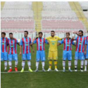
L'undici titolare del Catania