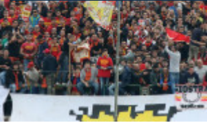
La Curva Sud gremita in occasione del derby con il Catania