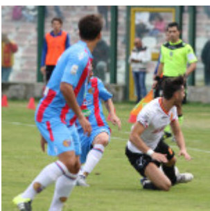
Un contrasto in mezzo al campo