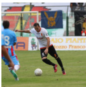
Parisi fondamentale in fase di chiusura ed impostazione