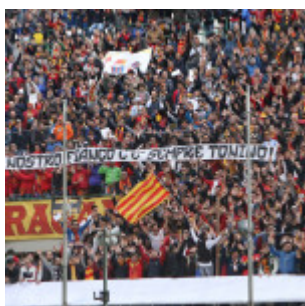
Il San Filippo sembra compiere un salto indietro di dieci anni con questo pienone