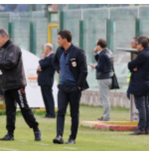
I due Di Napoli in panchina