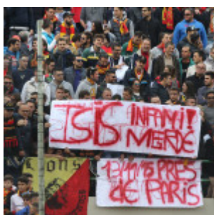
Anche la tifoseria del Messina condanna gli attentati terroristici