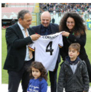
In posa per uno scatto dal grande valore simbolico, legato alla donazione degli organi