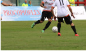
Una progressione di Giorgione