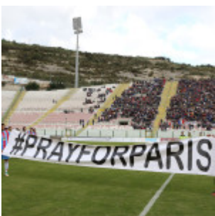
I capitani espongono un messaggio per Parigi