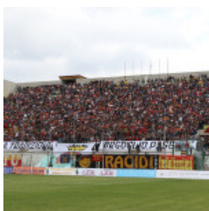
Curva Sud gremita