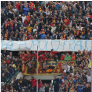
Un messaggio di cordoglio e vicinanza per i parigini