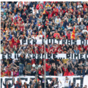
Tanti striscioni dedicati all'immane tragedia di Parigi