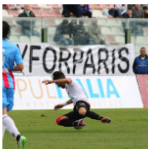
Bergamelli e compagni hanno limitato i danni