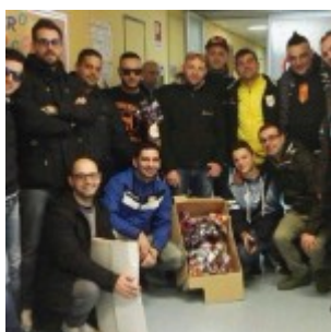
I rappresentanti dei gruppi organizzati in posa al Policlinico

I gruppi organizzati che sostengono l'ACR Messina hanno scelto il modo migliore per celebrare le festività pasquali. Grazie ad una raccolta fondi, Vecchia Maniera , Uragano Cep , Testi Fracidi , Nocs , Gioventù 1 , Giallorossa e Fedelissimi , hanno acquistato sei televisori ed un centinaio di uova di Pasqua, che sono state consegnate ai piccoli degenti del reparto pediatrico del Policlinico Universitario di Messina. Un'iniziativa davvero lodevole, che ha già fatto il giro del web. Nelle fotografie il racconto della piacevole mattinata.