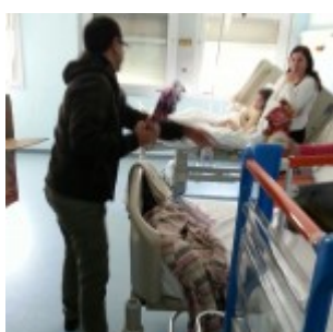
Le uova sono state consegnate nelle varie stanze del reparto