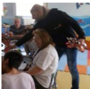
Uova di Pasqua e televisori sono stati donati ai bambini del reparto pediatrico