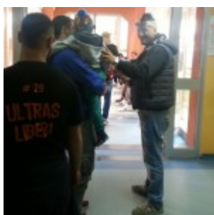
I tifosi hanno regalato qualche momento di spensieratezza ai piccoli degenti