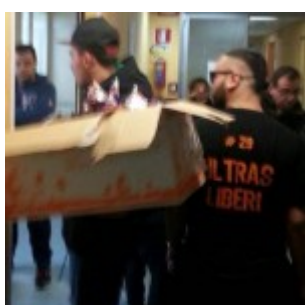
Ancora un momento della consegna delle uova di Pasqua ai bambini del Policlinico