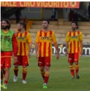
Grande delusione e fischi per i calciatori di casa