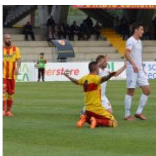
Eusepi atterrato in area: " rigore!