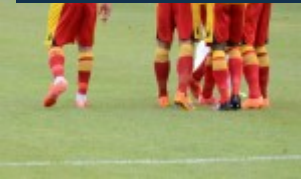
Il Benevento puÃ² celebrare la rete dell'1-0