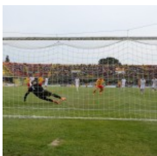
Berardi non ripete le prodezze riuscite contro Calderini e De Vena