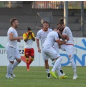
Nigro esulta dopo la rete del definitivo 1-1