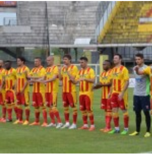
L'undici titolare del Benevento