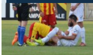
Pepe a terra dopo un contrasto