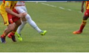
Cane e Ciciretti si contendono una maglia da titolare, per via della squalifica di Izzillo