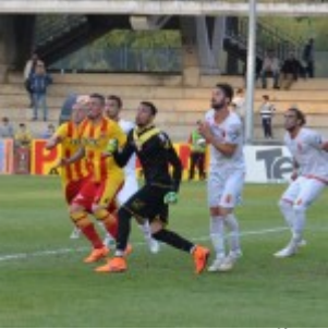
Berardi verrÃ confermato tra i pali