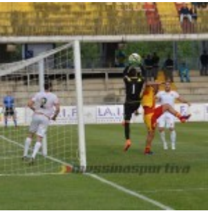
Una fase dell'ultimo Benevento-Messina