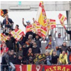
I tifosi del Messina a Benevento