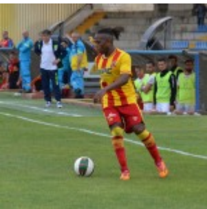
Som prova a sfondare sugli esterni