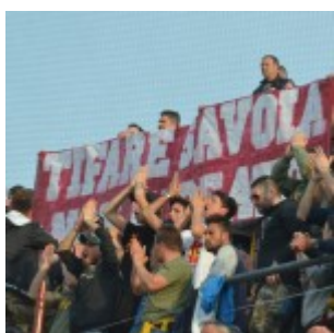
Stagione ricca di amarezze per il Savoia: sarÃ un anno zero per il calcio a Torre Annunziata