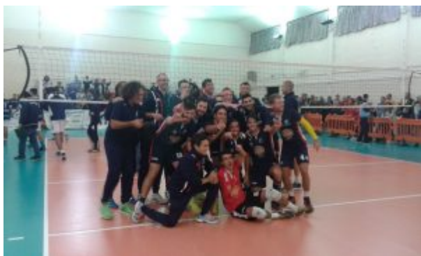
La Siciliana Maceri Volley Letojanni in posa sotto rete