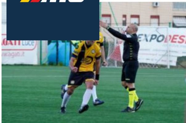
La Nuova Peloro fa festa al fischio finale