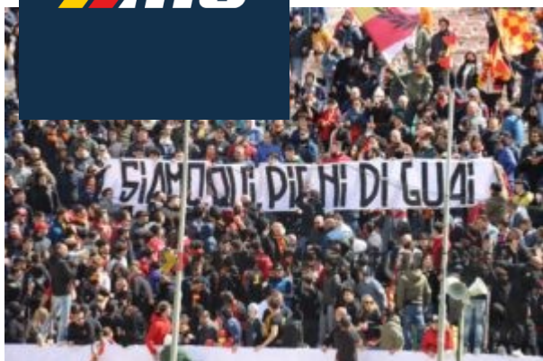
Uno striscione esposto in Curva Sud