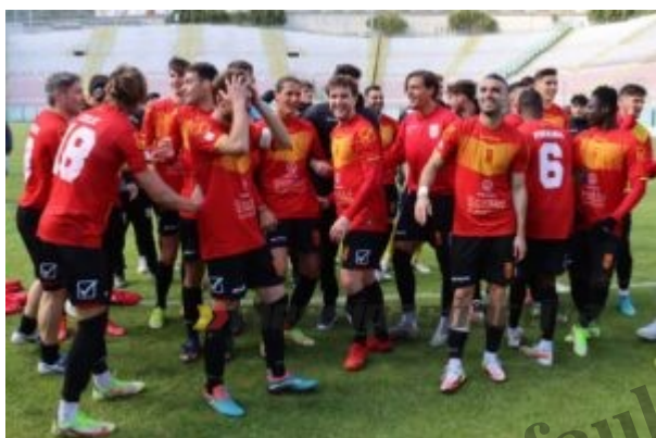
Il Messina si gode l'abbraccio dei tifosi