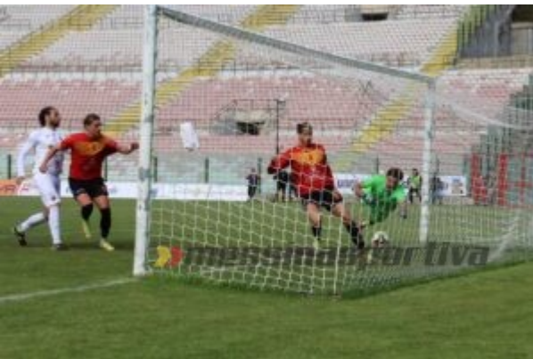
Chiorra non trattiene la punizione di Rizzo