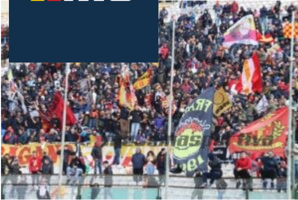
Le bandiere in Curva Sud