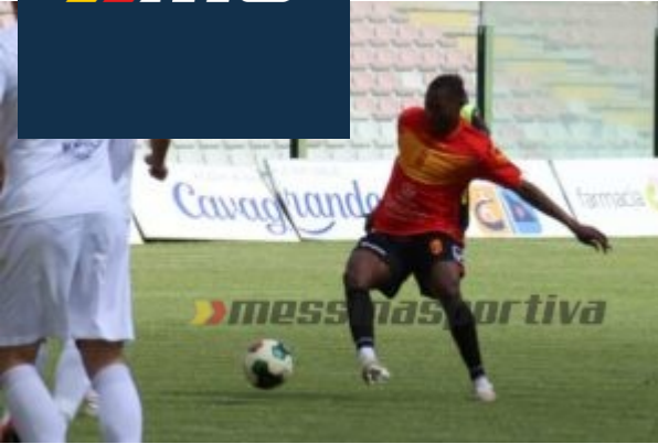
Fofana cerca di liberarsi al limite dell'area