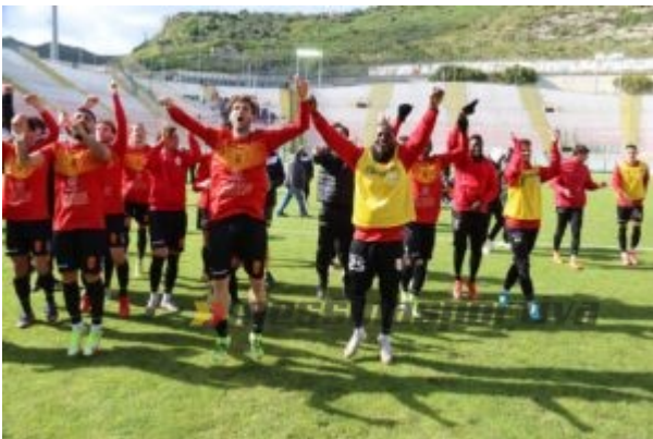
I protagonisti della salvezza fanno festa con i tifosi