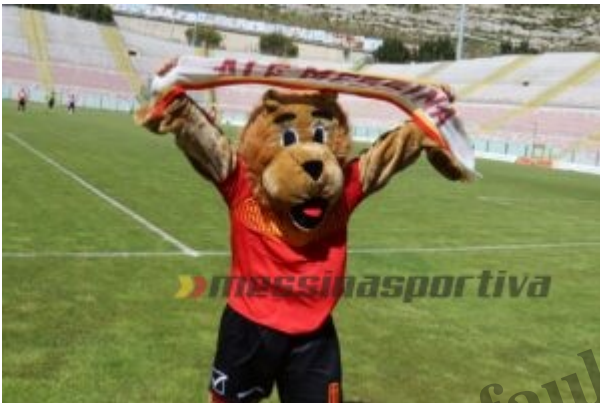
La mascotte del Messina