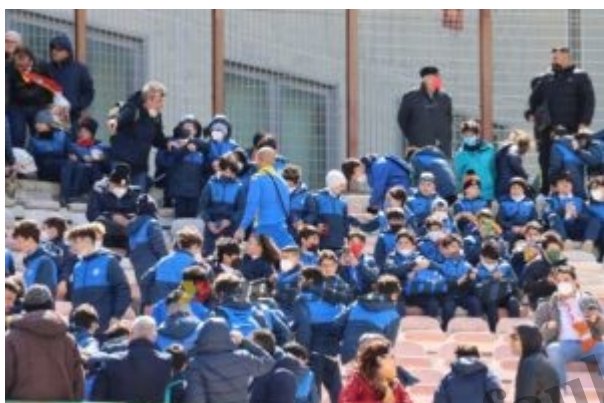
I giovani delle scuole calcio presenti allo stadio