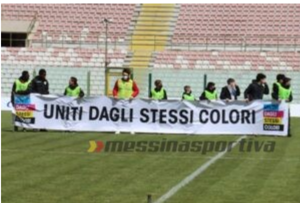
La campagna anti-discriminazione della Figc