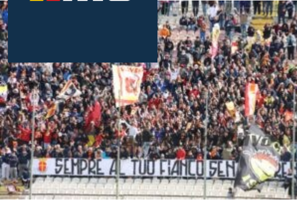
La grande cornice di pubblico nel match con il Taranto