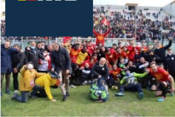
Grande festa sotto la Curva Sud