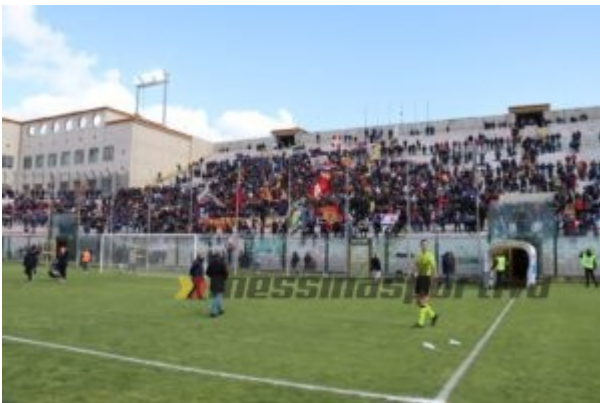
La Curva Sud gremita come non accadeva da anni