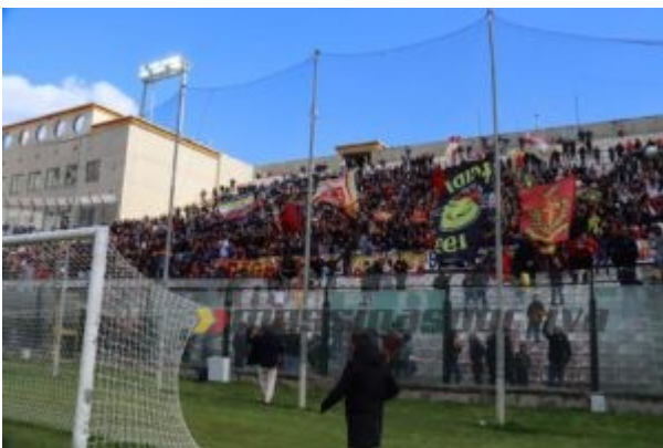
La grande cornice di pubblico del Franco Scoglio del 10 aprile scorso