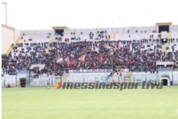
Il bel colpo d'occhio offerto dalla Curva Sud