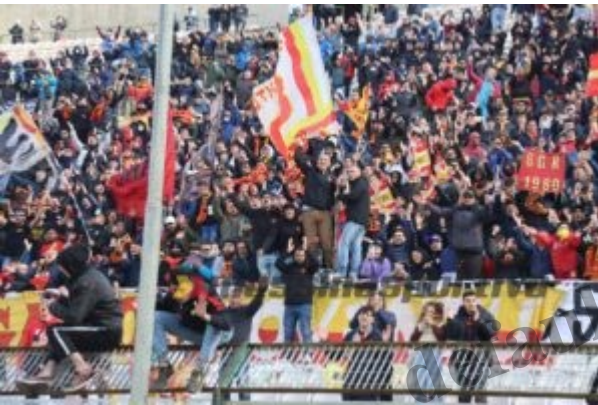
La Curva Sud nell'aprile scorso