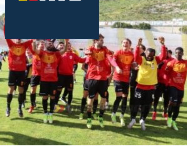
Il Messina salta e canta con la Curva