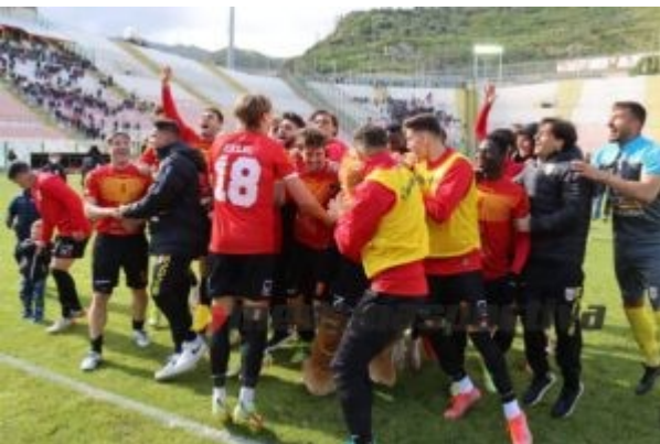
Gioia incontenibile per il Messina