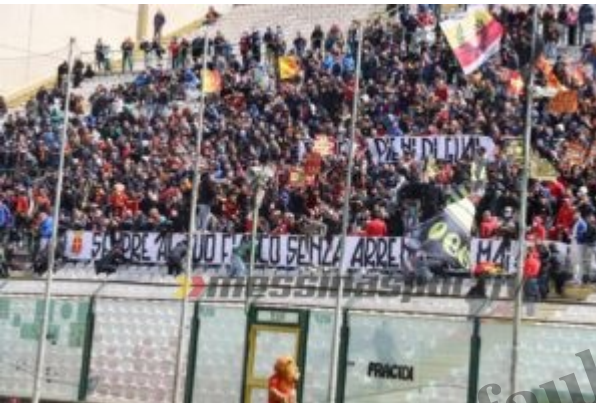
Gli striscioni esposti dalla Curva Sud