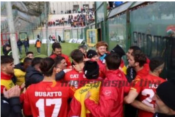
Il Messina fa festa sotto la Curva Sud