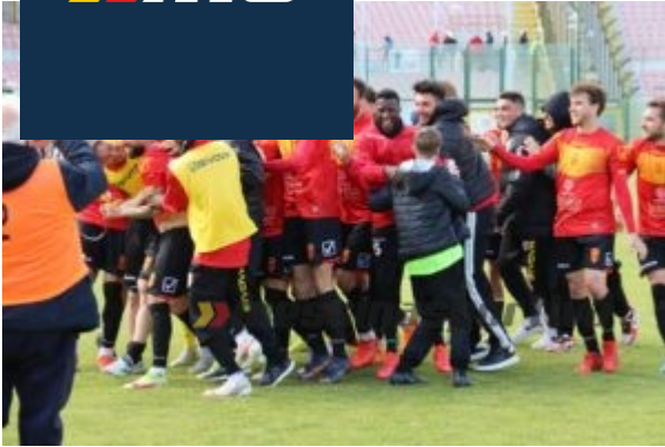
Il Messina celebra il gol salvezza