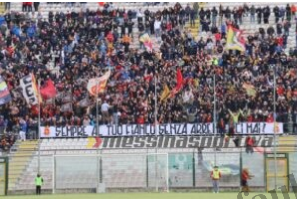
Oltre 3mila i presenti in Curva Sud