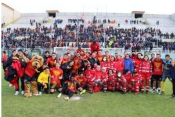
Il Messina celebra la salvezza con i tifosi