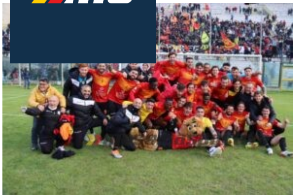
La festa salvezza del Messina, ancora ai nastri di partenza della C