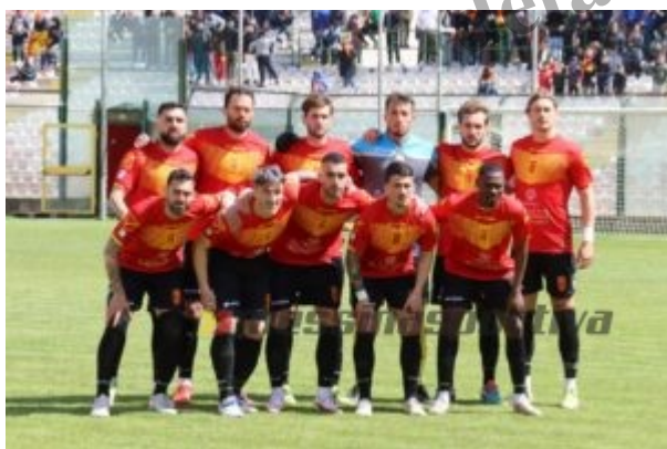
Una formazione titolare del Messina