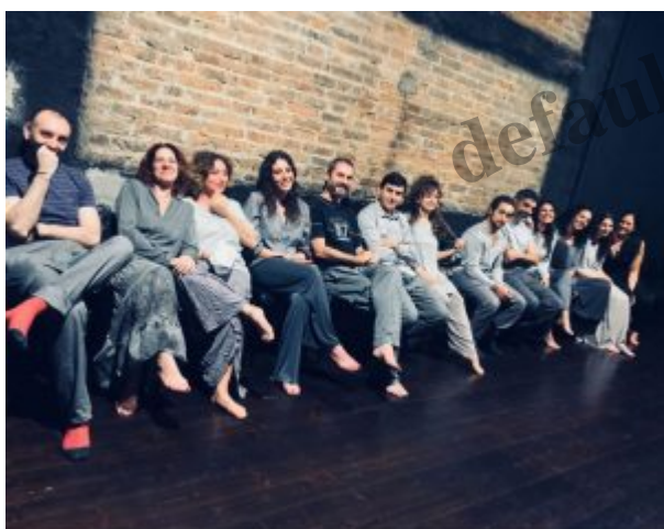
gli allievi della masterclass