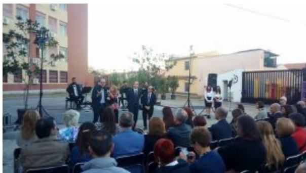
Spazio Gazzi Arte, il Presidio di Arte Urbana, una fase della manifestazione

Qui un muro, logorato dal tempo e piuttosto malconcio, si è trasformato in pochi mesi in una vera e propria opera d'arte grazie a pitture murali realizzate dagli alunni del Liceo Scientifico Quasimodo. Un muro, prima anonimo e freddo, è diventato simbolo di bellezza, di colore e al contempo di unità perché è in maniera inscindibile due Istituti con percorsi formativi diversi fra loro, ma portatori da oggi di un messaggio univoco e importante. È stata quindi una serata memorabile quella inaugurazione di Spazio Gazzi Arte, momento che ha voluto dare risonanza a un articolato ma encomiabile progetto pensato per rigenerare lo spazio antistante gli Istituti Quasimodo e Corelli, fornendo un'identità precisa e originale alla scuola e al territorio.