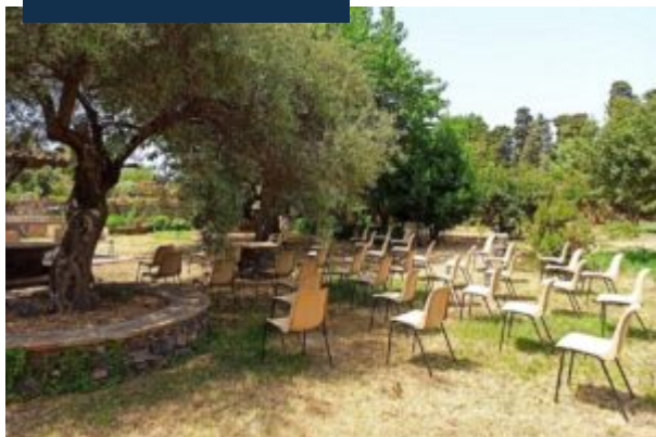
Il Giardino delle Rose nel Parco Archeologico di Naxos Taormina

fa la forza alla madre, la dea Demetra, da Ade, signore degli Inferi, divenuta sposa