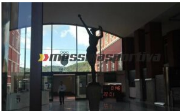
I locali interni del Coni

–Â giudizio iscritto al R.G. ricorsi n. 46/2020, presentato, in data 17 giugno 2020, dallaÂ A.S.D. Pomezia Calcio 1957 contro la Federazione Italiana Giuoco Calcio (FIGC), la Lega Nazionale Dilettanti della FIGC (LND),Â il Dipartimento Interregionale FIGC-LND;