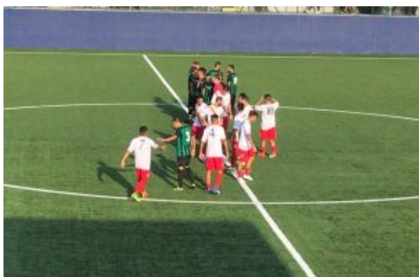
Il saluto tra le due squadre a fine gara