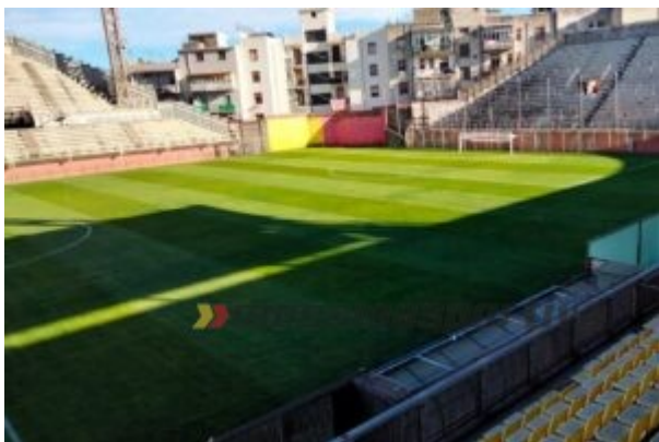
Il manto erboso del Giovanni Celeste nel febbraio 2021

“ Il Celeste di Messina ” continua D’Uva: “ha regalato ai messinesi e qui abbiamo vissuto l’entusiasmo della vittoria contro il Como che ha portato il nostro club allo storico gol di Buonocore contro il Palermo. Non si tratta solo di uno stadio ma di un vero e proprio simbolo della nostra città, non solo dal punto di vista affettivo ma, ora in poi, anche dal punto di vista formale. Una vittoria per tutti i messinesi”.