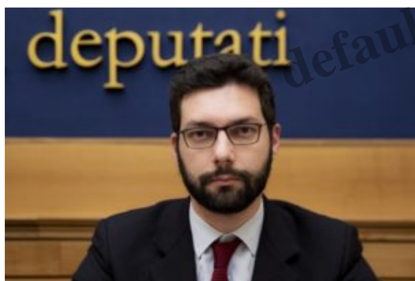
Il deputato del Movimento Cinque Stelle Francesco D'Uva

Lo stadio "Giovanni Celeste" di Messina, su delibera della Commissione del REIS, il Registro delle Eredit  Immateriali della Regione Sicilia,   stato inserito negli elenchi regionali dei LIM – luoghi dell'identit  e della memoria siciliana – tra i luoghi delle personalit  storiche e della cultura in quanto bene immobile legato alla storia sportiva e agli aspetti identitari della citt  dello Stretto.