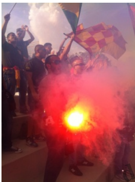
Tifosi igeani a Trecastagni