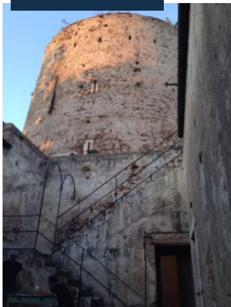
Torre degli Inglesi – Complesso monumentale Capo Peloro

p H ambasciatore della Repubblica Armena in Italia Sargis Ghazaryan, il premio