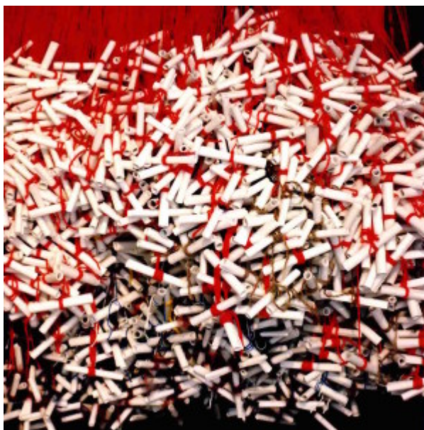
Amulett_4_ installazione site-specific di Salah Saouli

l'artista saulito, un omaggio alle acque del Leteo (Omaggio alle acque del Lete), realizzata dal polo Ramon De Soto, recentemente scomparso, in occasione della mostra "Nord-Ovest".