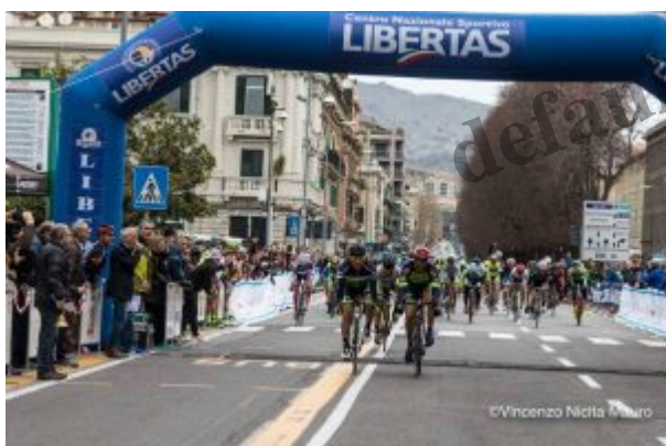
Trofeo dello Stretto – Prima batteria

L'anello di Via Garibaldi è stato lo scenario della seconda edizione del Trofeo dello Stretto , gara organizzata dal Barbagianni Team , col patrocinio dell'ente promozionale Libertas. Quasi 150 i partenti, suddivisi in due batterie.