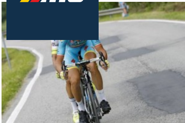
Vincenzo Nibali in discesa

“Sono rimasto passivo sulle ruote di Valverde, era uno strappo adatto a a lui. Ho cercato di trovare un accordo ma era difficile”. Vincenzo Nibali racconta cos’è le battute finali della tappa di Pinerolo del Giro, affrontata in scioltezza dal messinese dell’Astana, che ora dovrà tentare già da venerdì il colpaccio per rimettere in discussione il podio. “I tifosi lo sperano sempre, cerco di non deluderli – spiega a Raisport – è chiaro che non si può inventare tutto: se le gambe rispondono bene, sennò... Oggi comunque abbiamo trascorso una giornata abbastanza buona”.